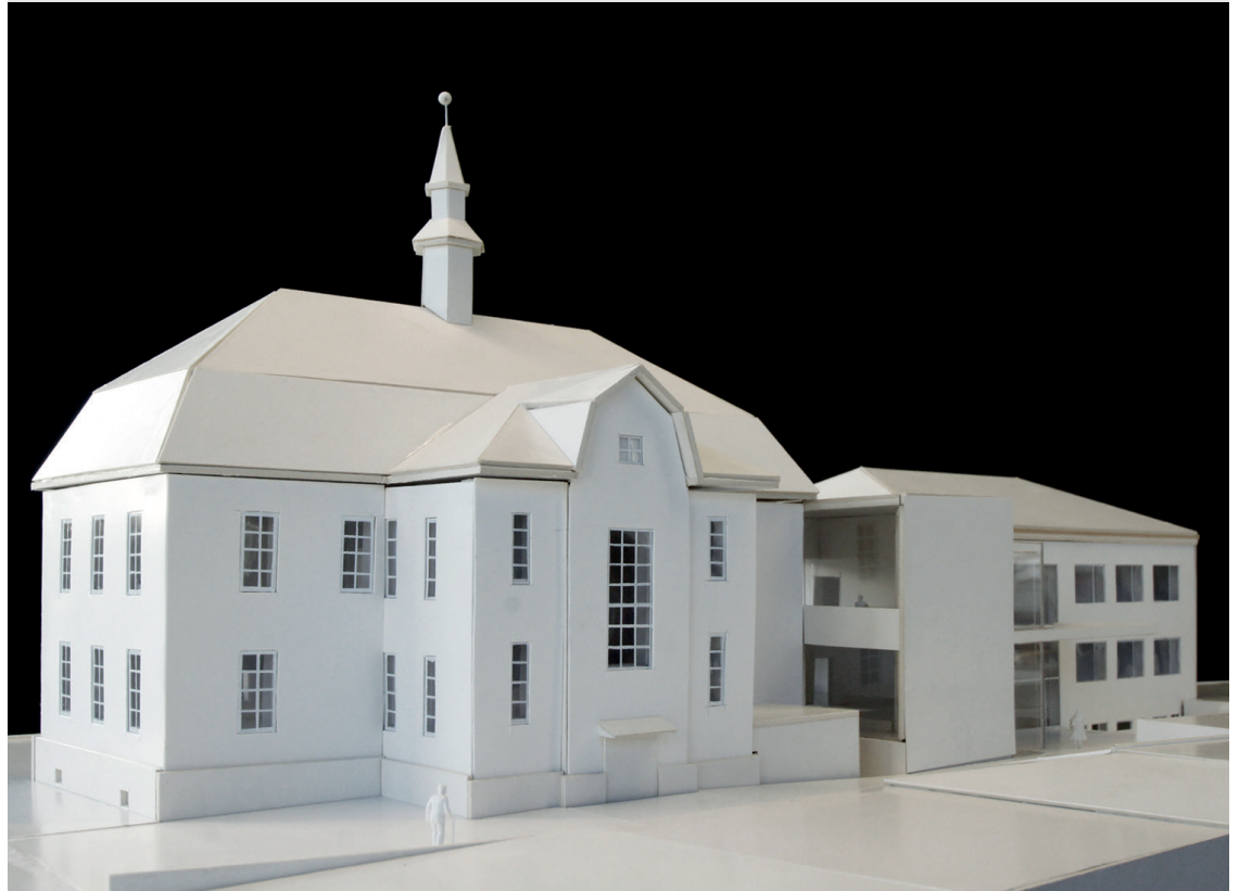
Modell Volksschule (Foto: architektur.terminal)